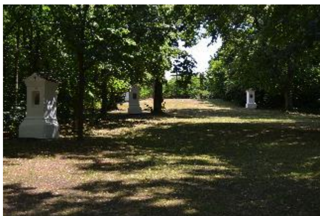
Křížová cesta v Hlubokých Mašůvkách

Expozice ukazuje zajímavosti související s působením zmiňovaných šlechtických rodů na Jevišovicku. Důraz je položen i na obrazy ze života prostého lidu. Návštěvníci mohou nahlédnout do tehdejší kuchyně, seznámit se s nástroji pro práci na poli i v dílně.