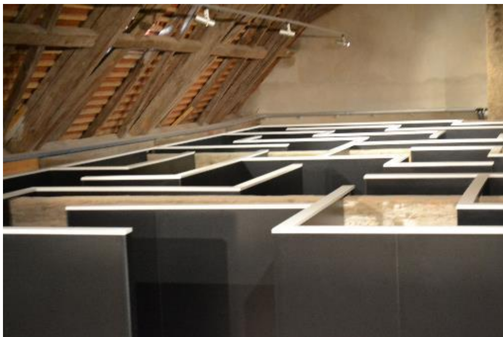
Bludiště v podkroví Předzámčí

Předzámčí Jevišovice otevřelo v duchu svého motta Historie a zážitky také zábavnou část expozice, kterou tvoří muzeum v podkroví jedné z budov Předzámčí. Zkusíte to?