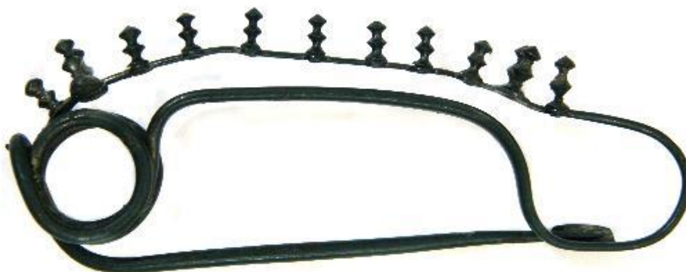
Spona z doby železné nalezená u Střelic