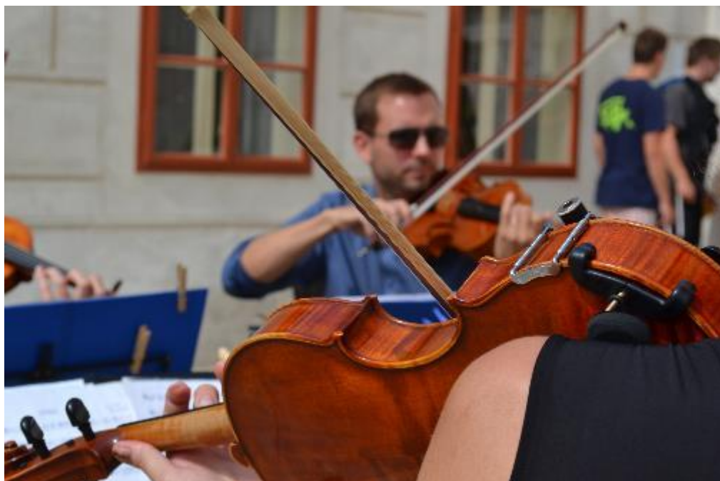
Koncerty jsou součástí kulturního života v Předzámčí Jevišovice